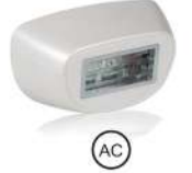
(لعلاج حب الشباب)