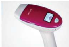
جسم الجهاز مع لمبة