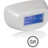
(النضارة وشد البشرة)