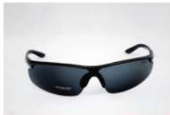
نظارة حماية العين